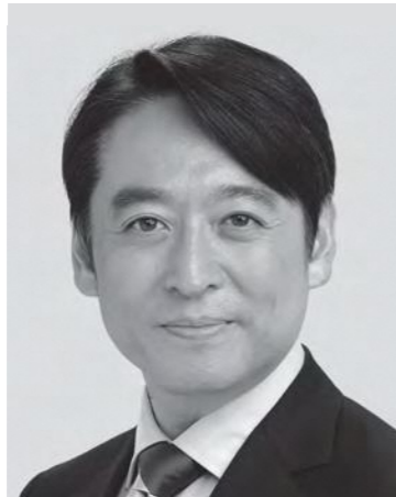
ひらき だいさく 現2 党関東方面本部長、同経済産業部会長。元復興副大臣。元経産大臣政務官。参院議員2期。経営学修士。東京大学卒。50歳。