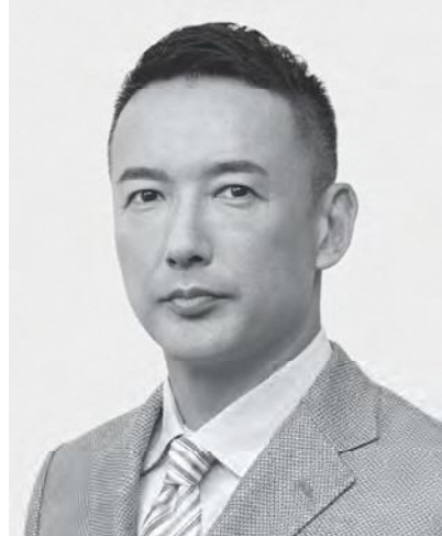
参議院議員 山本 太郎 (れいわ新選組 代表)