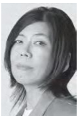
ミサオレッドウルフ (自営業)