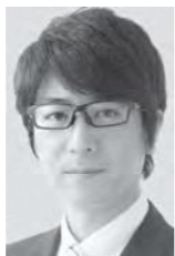
にとうへつとま (自営業)