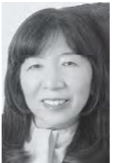
木村英子 (参議院議員)