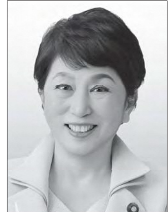
社民党党首 福島みずほ