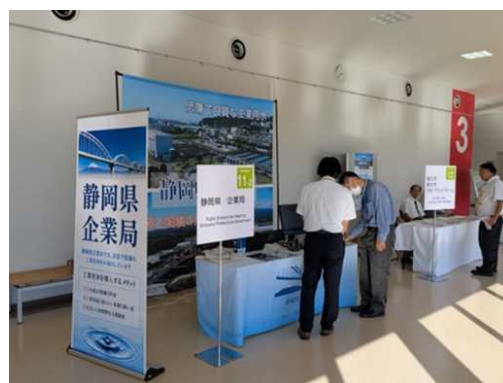
＜ふじのくにセルロース循環経済国際展示会＞