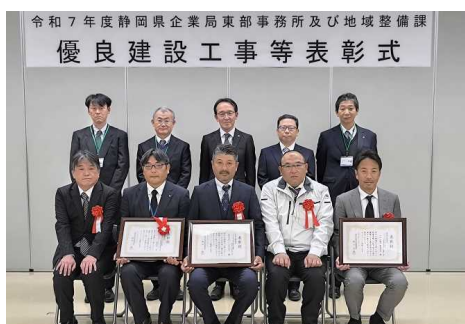
▲東部事務所表彰式（11月18日開催）