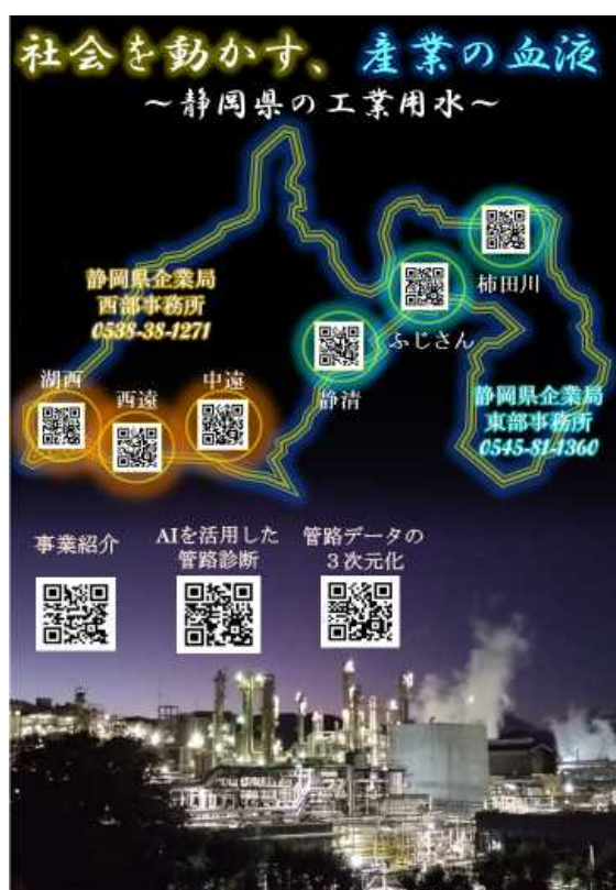
＜局職員がデザインした工業用水PRチラシ＞

工業用水道事業の経営は独立採算制で行われていますので、こうした広報活動を通じて、新たな契約の実績が増えることは、料金収入の増加による経営状況の改善を通じて工業用水の安定給水に繋がります。 今後も、積極的にイベントへ出展する等、工業用水の利用拡大に繋がる活動を行ってまいります。