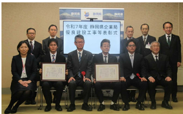
▲記念撮影（受賞者と企業局幹部職員）