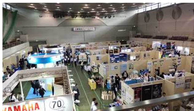
＜産業振興フェア in いわた＞