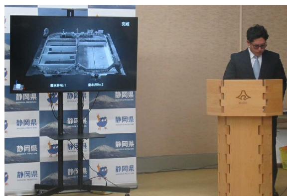
▲施工技術者による工事報告