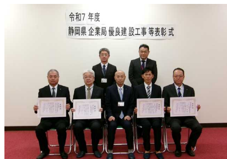
▲西部事務所表彰式（11月19日開催）