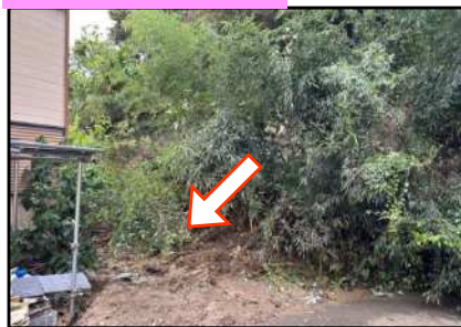
土地所有者が土砂を撤去