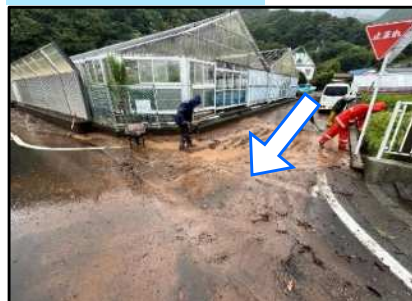
地元住民が土砂を撤去