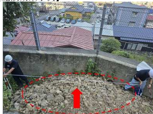
がけ崩れ(下田市西本郷)9月5日発生 ※令和6年6月豪雨でのがけ崩れが発生し、施設効果を発揮。速やかに撤去し再度土砂を捕捉