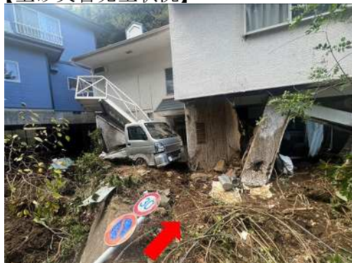
がけ崩れ(伊東市川奈)9月5日発生