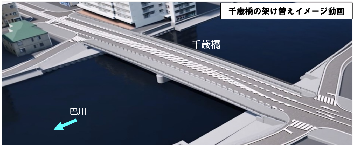
千歳橋の架け替えイメージ動画