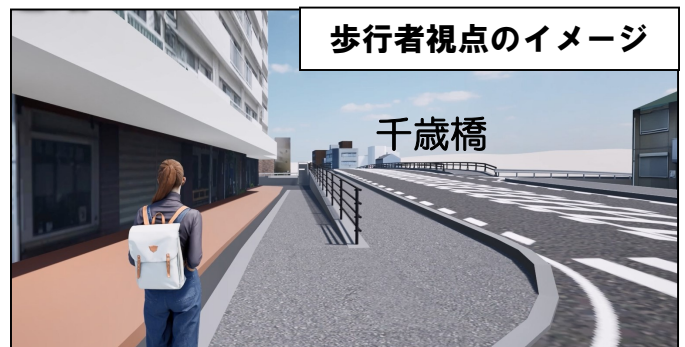
歩行者視点のイメージ