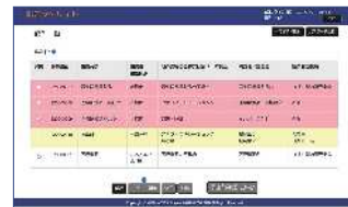
◀報告書登録済みの場合