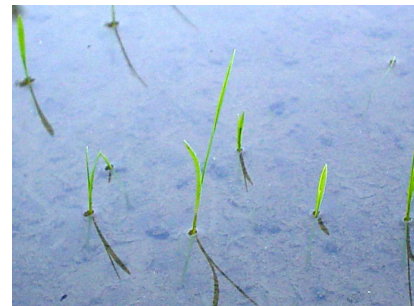
ノビエ 1.5 葉期