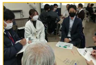
▲災害ボランティア連絡会

1月30日に、災害時に備えた日頃からの関係構築を目的として開催しました。管内市町のボランティア関係団体、社会福祉協議会等との意見交換を実施しました。