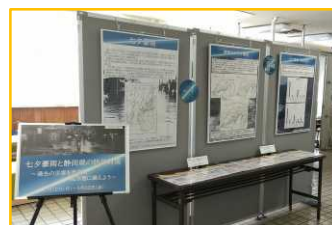
▲七夕豪雨に関する企画展

過去の災害を教訓に防災意識を高めてもらうため、東部地域で過去に発生した地震や津波、豪雨、土砂、火山災害に関する企画展やSNSでの情報発信を実施しました。