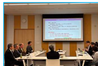
▲三島駅インバウンド誘客検討会

伊豆半島地域でインバウンド誘客・受入体制強化に取り組む特徴的な事例や、外国人視点から伊豆半島の魅力を紹介する事例集を作成しました。