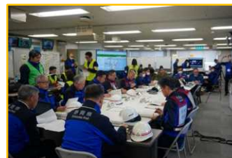
▲地震対策オペレーション

1月16日に、阪神・淡路大震災を契機とした訓練を実施しました。県が実施する災害応急対策の習熟・検証や、関係機関との連携強化を目的としています。