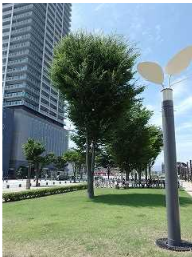
写真1-3 照明灯 a と樹木