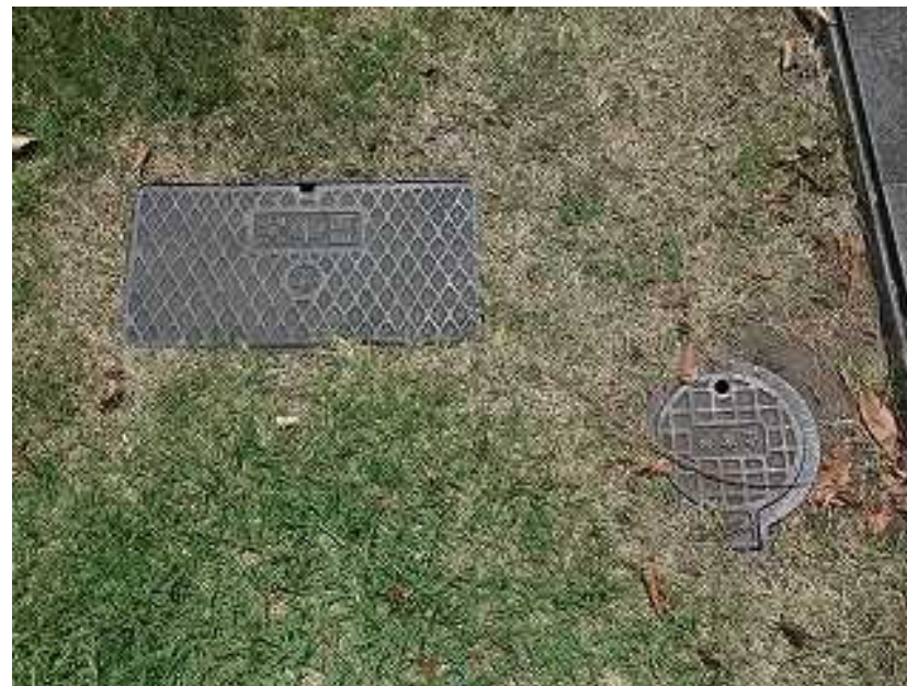
写真1-6 量水器(上)と止水弁(下)