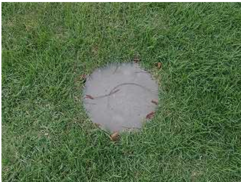
写真1-7 プラスチック製フタ