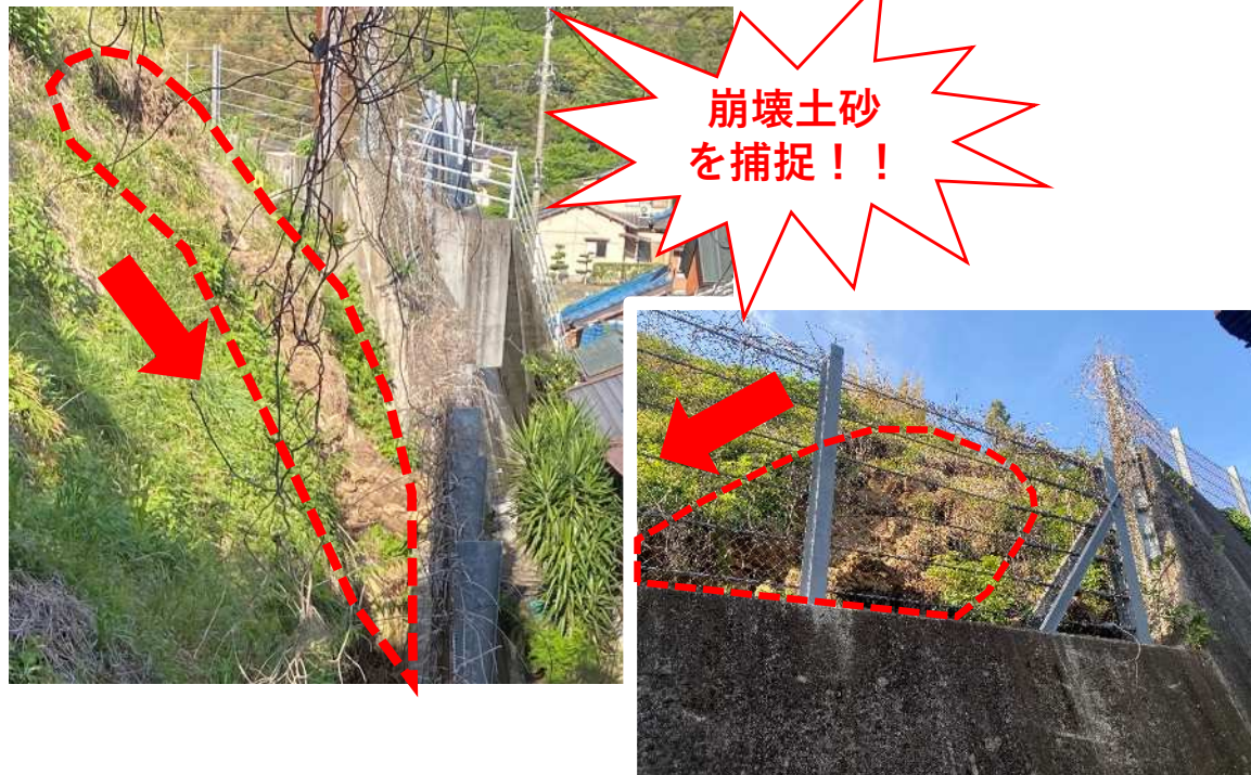
急傾斜地崩壊防止施設 (落石防護柵及び重力式擁壁)