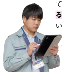
会議などではタブレット端末を使ってメモをすることも