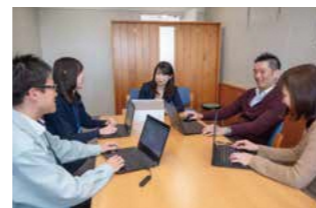
局長室でメンバーと打合せ。相談しやすい環境作りを心掛けています

新型コロナが猛威を振るい始めた令和2年、医療・福祉面の組織体制づくりを担当しました。部局を越えた全庁体制で、猛スピードで深刻化する状況に対応する日々は、県民の安心・安全を守るという公務員の原点を再認識する貴重な経験となりました。