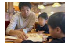
育児中。午前中に子どもと近くのカフェへ。平日のゆったりとした時間に絵本を読んであげられました