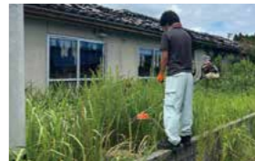
町営住宅の空き家管理の業務中。町では予算も少ないので職員が自ら行うケースがあり貴重な体験でした

【派遣先】石川県能登町役場 建設水道課（派遣期間：令和6年5月1日～令和7年3月31日）