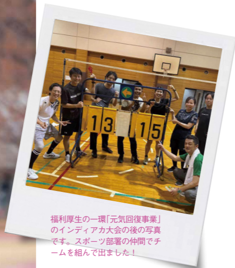
福利厚生の一環「元気回復事業」のインディアカ大会の後の写真です。スポーツ部署の仲間でチームを組んで出ました！

県職員は、民間企業を「支援」することで、県民の皆さんのより良い生活の実現を目指す「縁の下の力持ち」。胸を張れる仕事だと思います。