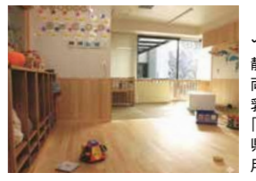
ふじさんっこクラブ 静岡県には、仕事と子育てを両立する職場環境の整備のため、乳幼児の一時預かり保育施設「ふじさんっこクラブ」があります。県庁に用事で来庁される方も利用できます。