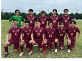
県庁サッカークラブ