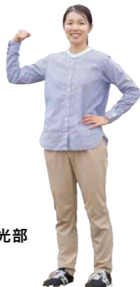
各スポーツチームのユニフォームを着ることも多いですが、普段の服装はこんな感じ

県庁の仕事のフィールドは広くて多岐に渡ります。先輩職員はそれぞれの現場で何を想い、どう動いているのか。5人の最前線を紹介していきます。