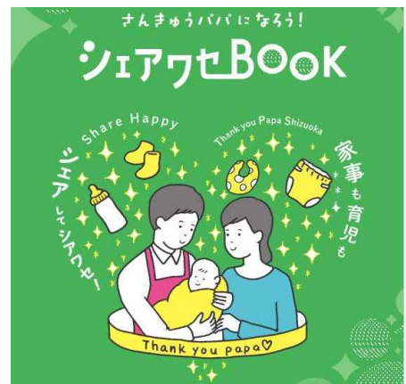
静岡県版父子手帳