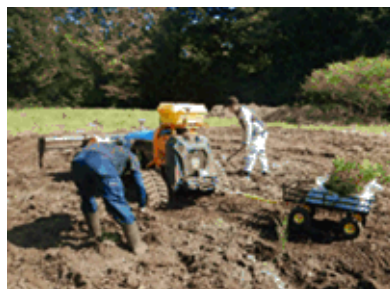
自律走行式電動クローラと自律走行式地拵え機（植穴穿孔）