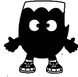
静岡県イメージ キャラクターふじっぴー