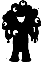
大阪・関西万博 公式キャラクターミャクミャク