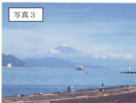
(三保の松原周辺)