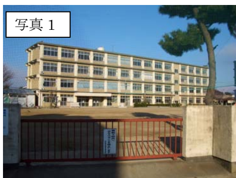
(廃校となった学校跡地)