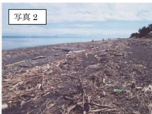
(三保の松原周辺の漂着物)