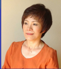
オ ソンファ 呉 善花 氏