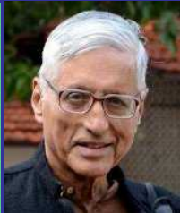
ラジモハン ガンジー Rajmohan Gandhi 氏