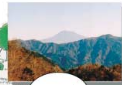
富士山が見えるよ