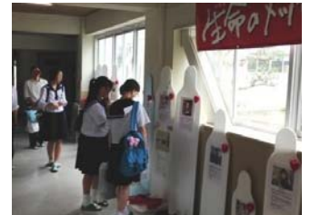
生徒昇降口での展示