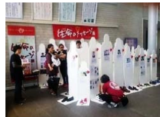
市役所ロビーでの展示