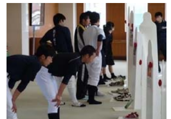
部活動の合間に来場