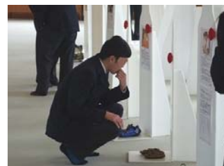
展示を見つめる男子生徒