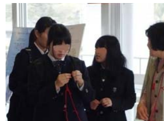
赤い糸を紡ぐ生徒