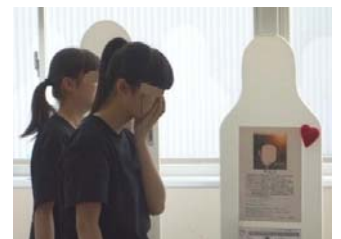
思わず涙ぐむ女子生徒