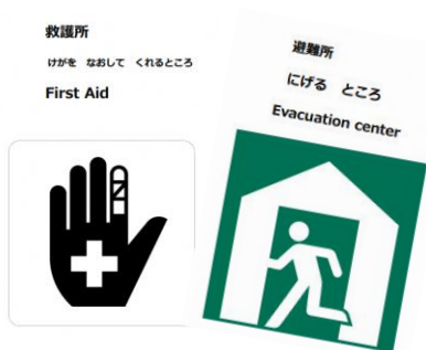
災害時の避難所で↑