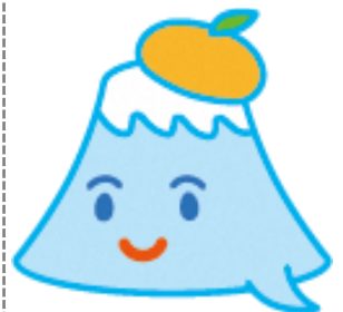
静岡県に住むやさしい富士くん