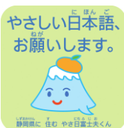
←イメージキャラクター「やさ日富士夫くん」と「やさしい日本語」ロゴマーク