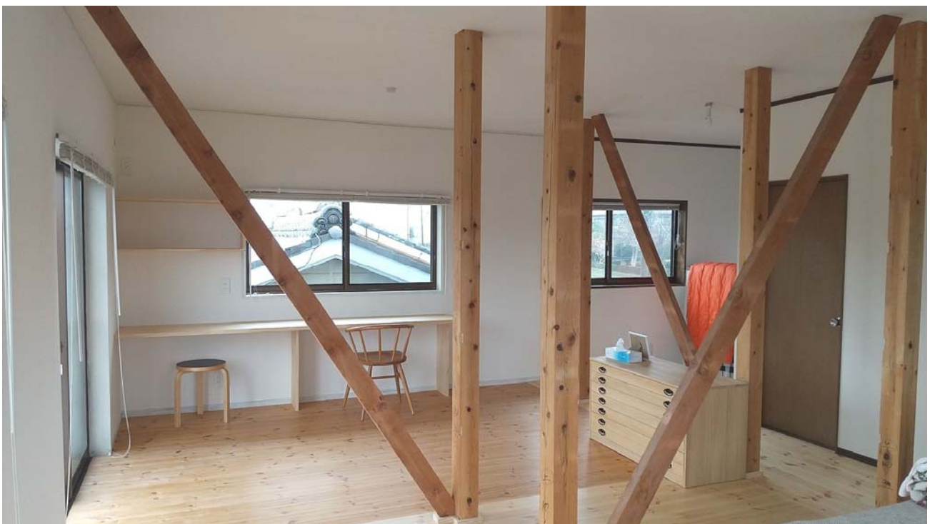
テレワーク対応リフォーム施工事例

ここでは、事後アンケートにおいて写真の掲載許可をいただいた申請事例の一部をご紹介します。