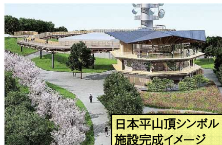
日本平山頂シンボル施設完成イメージ