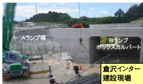
倉沢インター建設現場