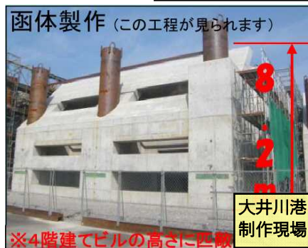
函体製作(この工程が見られます)