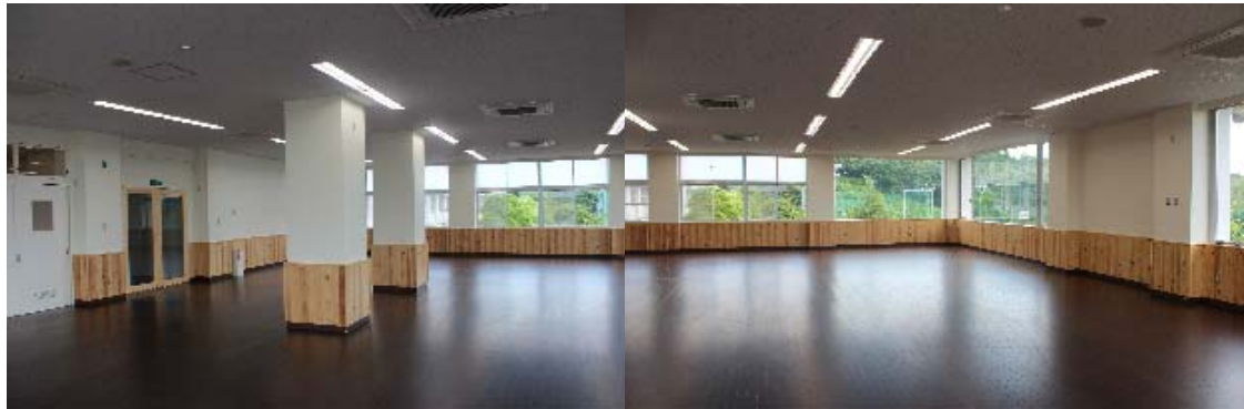
西棟2階:職員室 → コミュニケーションルーム