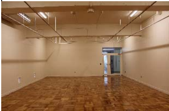
各階:教室 → 展示室