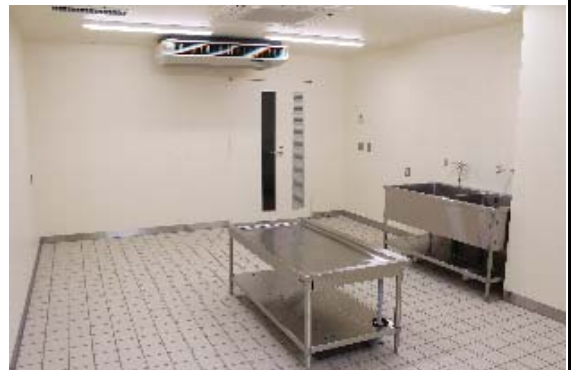
南棟1階:便所 → 解剖室