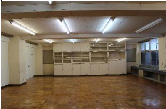
北棟1階:生物教室 → 収蔵室4