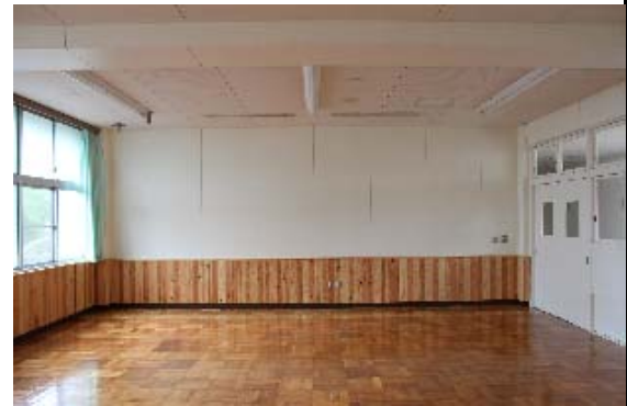
各階:教室 → 研究室、講座室