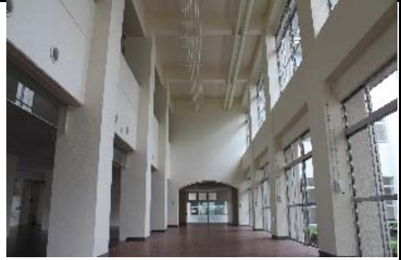
西棟1階:生徒昇降口 → 展示ホール