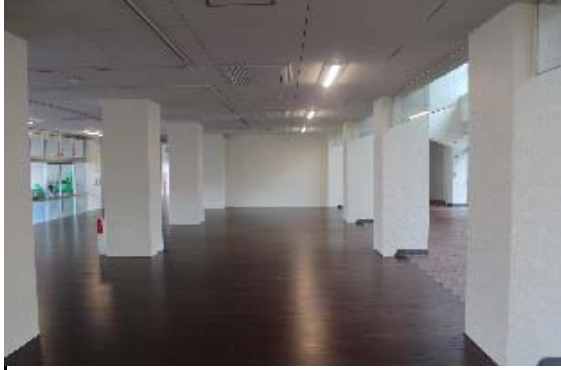
西棟1階:生徒昇降口 → 展示ホール