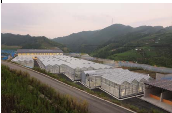
温室(敷地南側より)