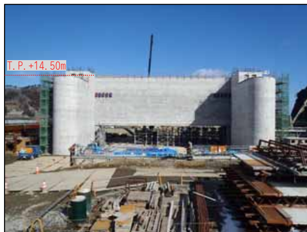
鵜住居川水門工事 カーテンウォール打設完了状況

甲子川水門工事では、工程短縮を図るため、コンクリート二次製品を用いたカーテンウォールの据付けを実施しています。現場でコンクリートを打って築造するよりも、約4ヶ月の工程短縮が可能となります。