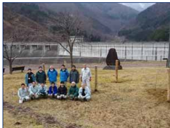
日向ダムを背景に集合写真