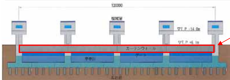
甲子川水門 断面図

カーテンウォールとは ・ゲート設備の省コスト化のため設ける部分で、ゲートと一体となって堤防の効用を果たすもの。