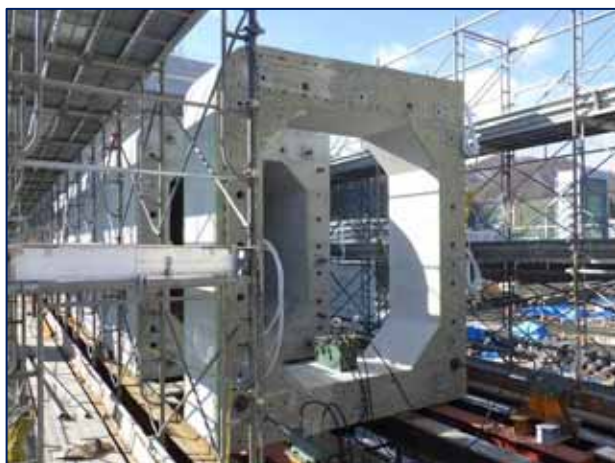
甲子川水門工事 プレキャストカーテンウォール据付け状況

鵜住居川水門工事では6基ある堰柱の内、完成した2基の堰柱間のゲート上部にコンクリートの壁（カーテンウォール）が出来上がりました。この後、ゲートの設置作業に取り掛かります。