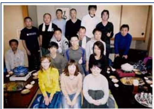
慰労会で集合写真（夏虫のお湯っこ：大船渡）