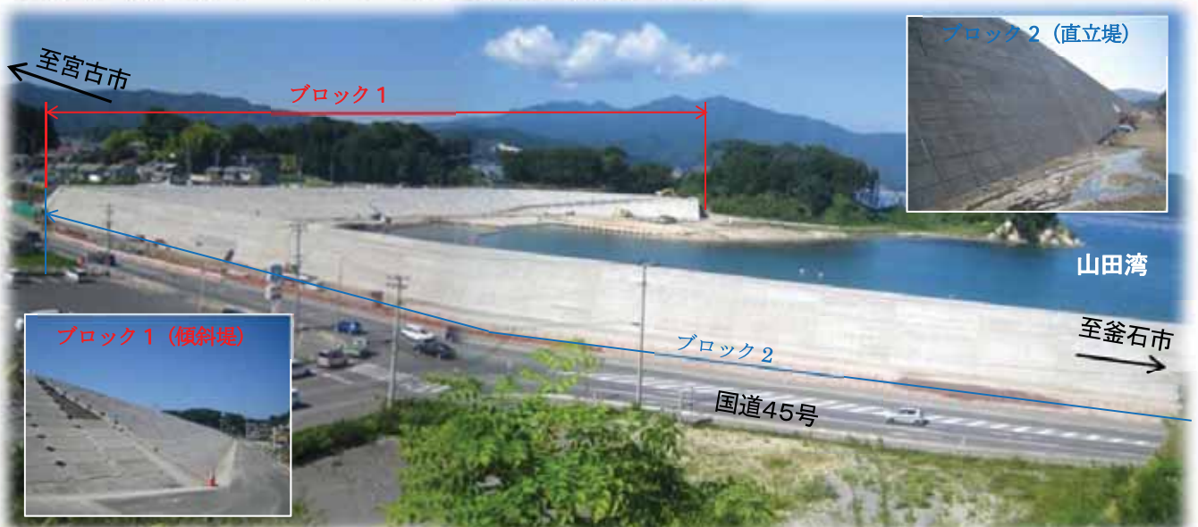
織笠漁港海岸(ブロック1,2)災害復旧工事の状況

我々が担当する「織笠漁港海岸」、「小谷鳥漁港」の災害復旧事業についても、着実に工事を進めているところであり、「織笠漁港海岸」のブロック1、2は、まもなく完成する見込みです。