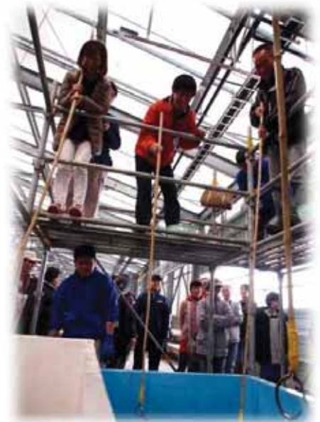
カキ・ホタテすくいの状況