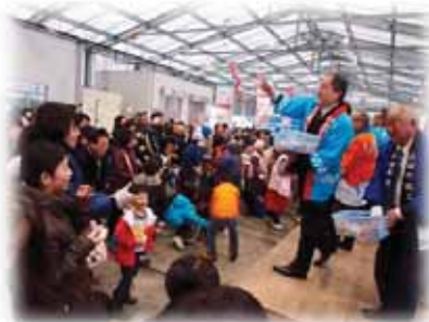
「カキまつり」の状況