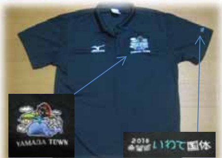
国体ロゴ入りポロシャツ

山田町では、高校野球(軟式)が開催される予定ですが、国体を盛り上げるために、全庁を挙げて、国体のロゴ入りポロシャツの着用運動を実施しており、我々派遣職員も、9月1日から大会終了の10月11日までの間、毎週火曜日、金曜日に着用して職務に当たっています。