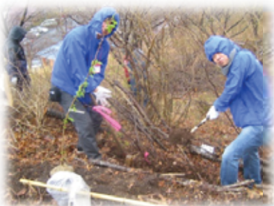
「さくらまつり」での植樹の状況

どのイベントも大盛況で、中でも、「カキまつり」は、カキ・ホタテすくいや、カキむき体験、バーベキューコーナーなどイベントが豊富で、おいしい海産物を安く購入できました。