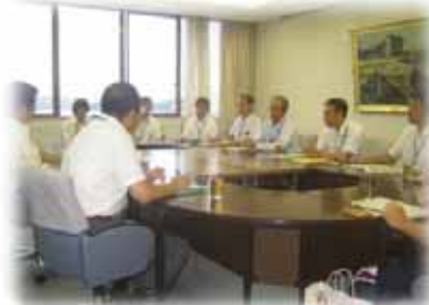
町長等の面談の状況