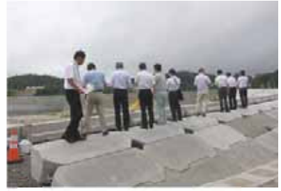
災害復旧工事の視察の状況