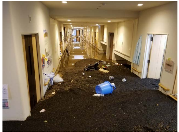
台風19号による土石流で土砂が流入 地域の声かけによる事前避難で人的被害ゼロ