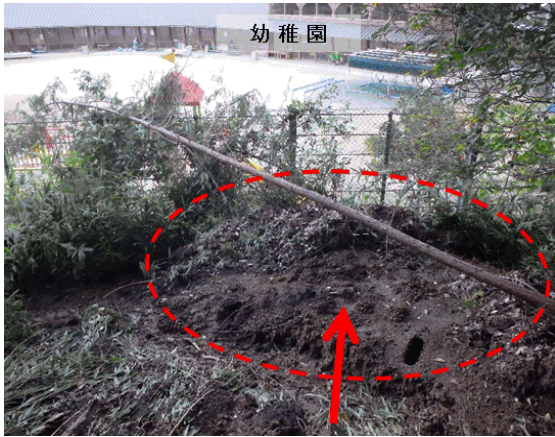
擁壁が幼稚園への土砂流入をストップ！ 「伊達方諏訪」(掛川市伊達方) 災害発生日:10月12日