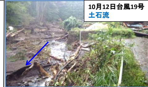
10月12日台風19号 土石流