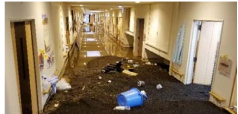
施設1階への土砂の流入状況