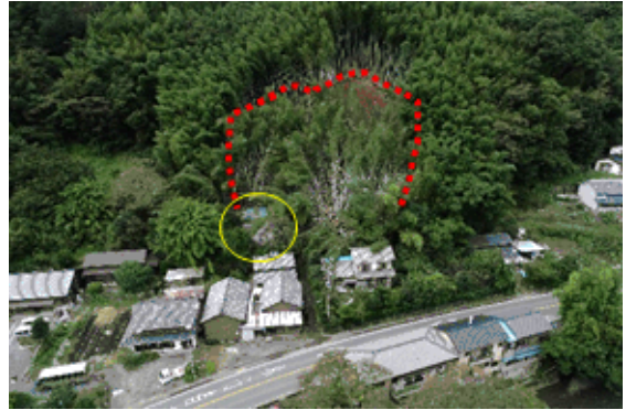
人家1戸が全壊、事前の避難により人的被害なし 「小河内下土」(静岡市清水区小河内) 災害発生日:10月13日