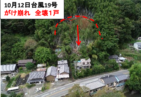
10月12日台風19号 がけ崩れ 全壊1戸