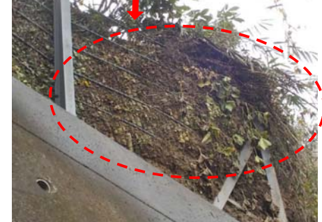
「公文名」急傾斜（菊川市西方）