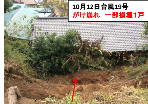
10月12日台風19号 がけ崩れ 一部損壊1戸