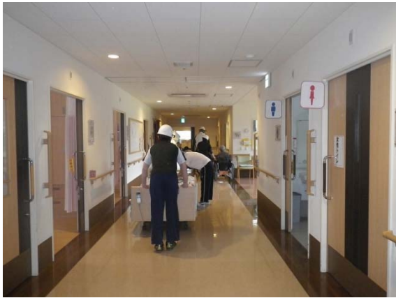
特別養護老人ホーム(駿東郡小山町) 本年6月に避難訓練を実施