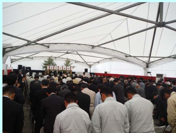
➤ 厳かに神事が執り行われました。