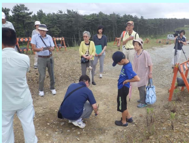
➤ 高さ 13.0m の防潮堤の上で高さや硬さ、植栽状況を確認