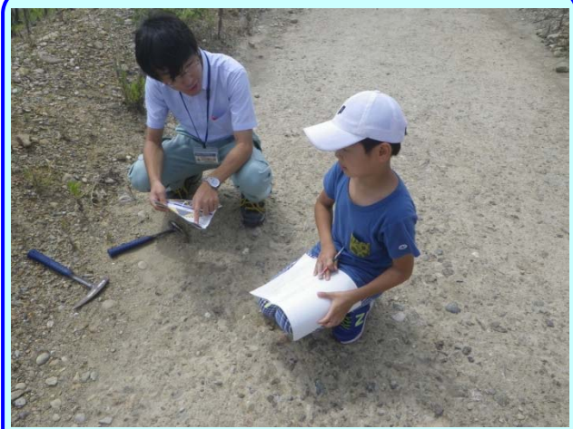
➤ 夏休みの自由研究頑張って！