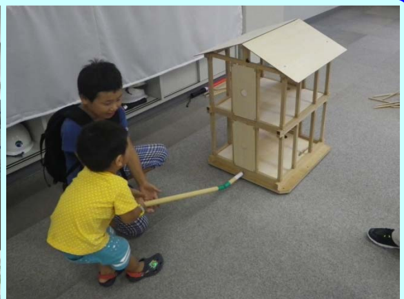
一生懸命引張って地震に強い家のお勉強