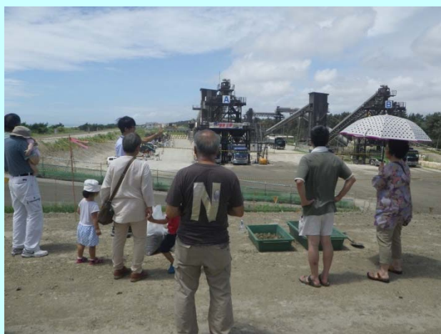
➤ 防潮堤の材料となるCSGがどの様に造られているか見学

ご来場の皆様からは、「硬いことに驚いた」、「コンクリートの壁を想像していたがイメージと違って驚いた」、「夏休みの自由研究にしようと思った」といったご感想や、「防潮堤の上からの景色が良いので完成してからの利活用を考えて欲しい」、「15mまで嵩上げして欲しい」、「中田島砂丘の区間はいつ完成するのか」、といったご意見やご質問の声をいただきました。