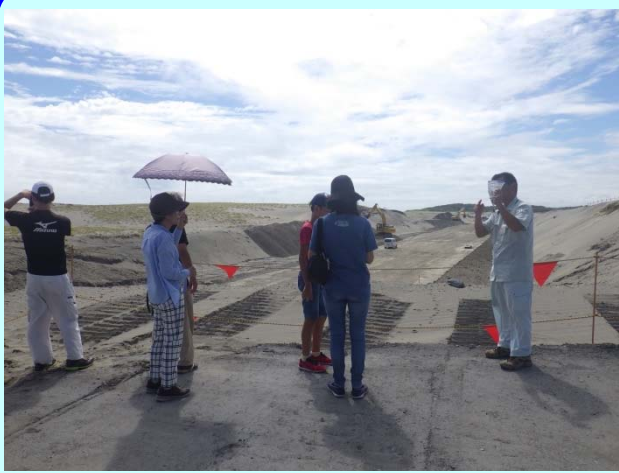
➤ 中田島砂丘で施工中の防潮堤を見学