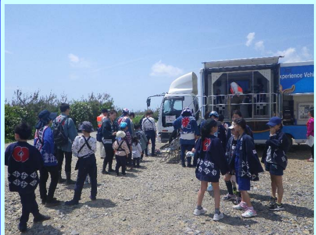
➤ 地震体験車で震度7の地震を体験

ご来場の皆様からは、「防潮堤は土だけで出来ているのか」、「いつ完成する予定なのか」、「中田島ところは15mより高くかさ上げする予定はあるのか」、「完成後はどのような利用方法となるのか」、「階段や防潮堤の上は普段から一般開放されているのか」、「海岸への出入り口は、これ以上増やす予定はないのか」、「馬込川の対策はどうなるのか」、「こんなにすごい物を造っているとは知らなかった。日本に誇れる構造物だと思う。もっと積極的にPRしてほしい。」、「今は防潮堤の上に登ると風揚げが見やすく非常に良いと思う。計画的に木を植えて、今後も浜松まつりが見られるようになったらいい。」といったご質問やご意見・ご感想の声をいただきました。