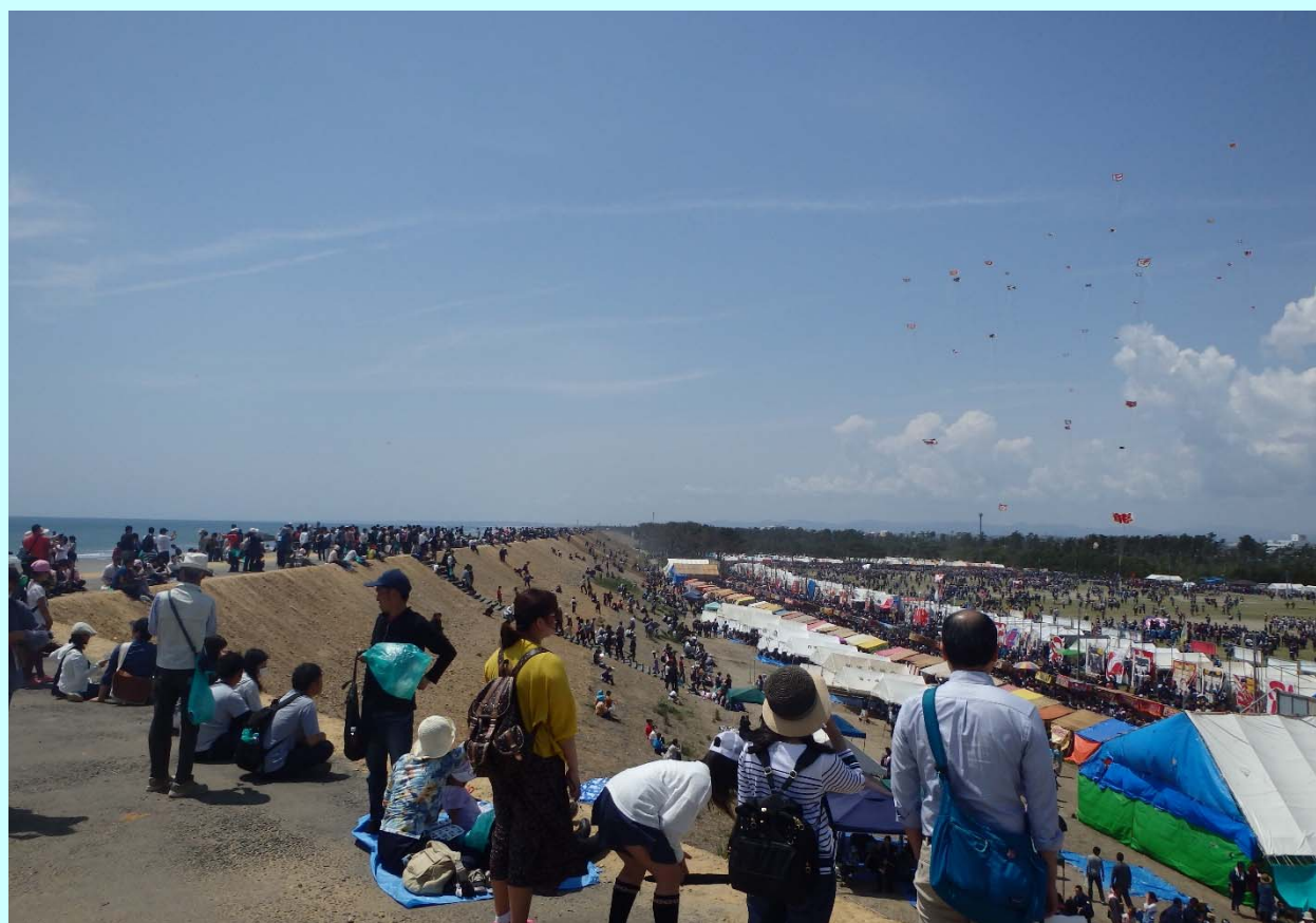
➤ 防潮堤の上から浜松まつりを見学