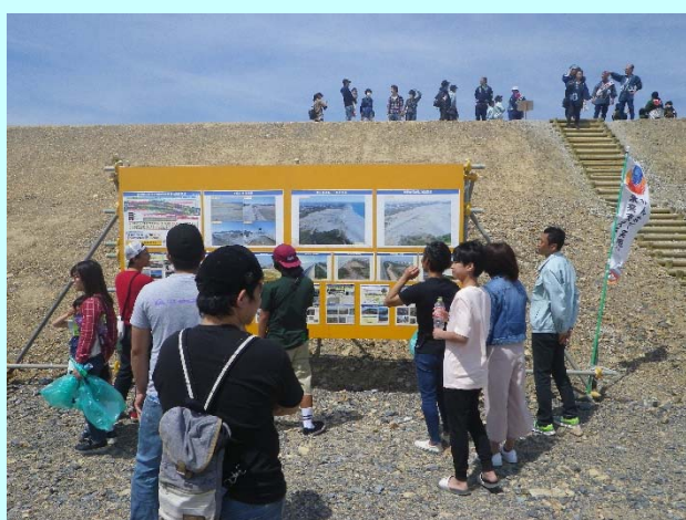
➤ パネルで防潮堤の概要を見学

凧揚げ会場南側の防潮堤が完成して初めての浜松まつりとなり、大勢の皆様が防潮堤の上から天高く舞い上がる凧を観覧されていました。