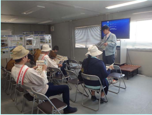
➤ DVD・パネルで防潮堤の概要を見学