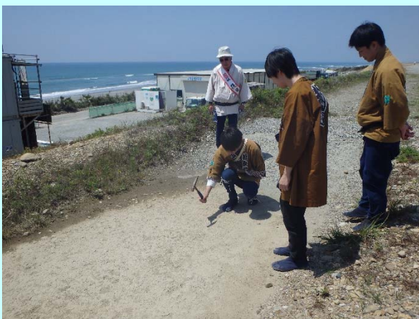
➤ 防潮堤の硬さを実感