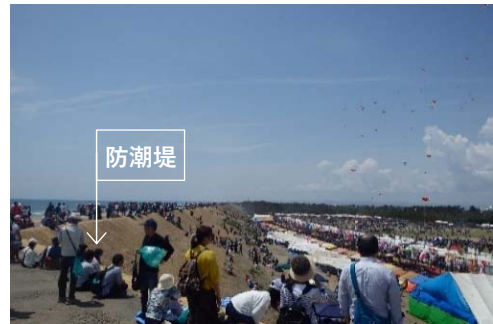
防潮堤の上から浜松まつりを見学 (令和元年5月)

防潮堤建設中の視察者は 約31,000人 でした！ ご来場の皆様ありがとうございました。