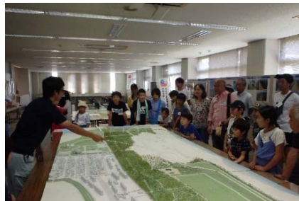
↑ 防潮堤資料室での 見学の様子