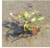
ギンヤンマの産卵