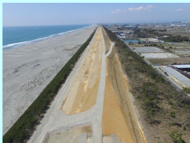
➤ 篠原 3 工区の築堤が完成 (引続き植栽を実施する予定)