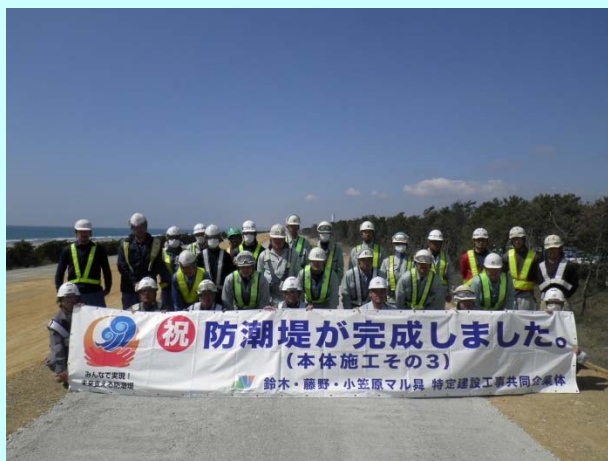
➤ 篠原 3 工区を施工した作業員の皆さん