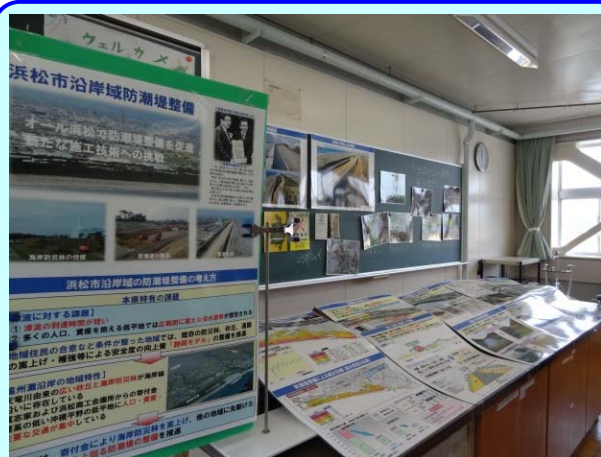
➤ 防潮堤の概要パネルを展示