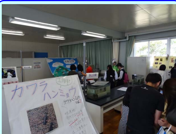
➤ 多くの皆様が来場