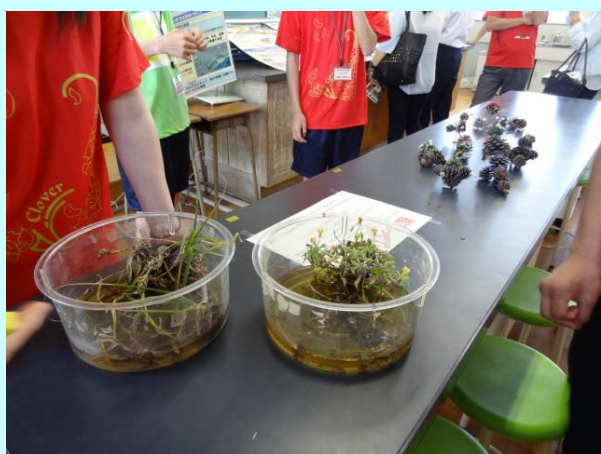
➤ 在来植物と外来植物の違いを説明