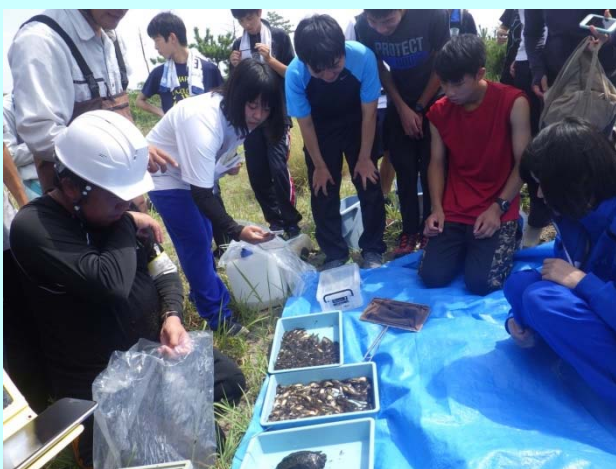
➤ 大きなナマズやたくさんの外来種を捕獲