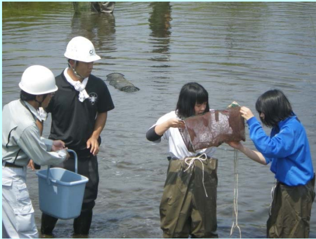
➤ 前日に仕掛けておいた罟を回収