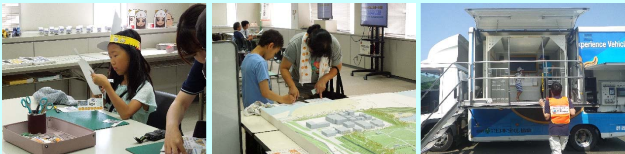
➤ 資料室では防潮堤の構造や材料の造り方についてご見学&防潮堤クイズ、地震体験車、ペーパークラフトに挑戦