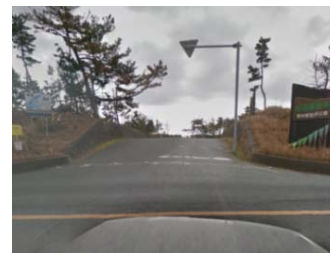
遠州灘海浜公園入口

※歩行者のみ通行可。 工事エリアを横切するため、誘導 員の指示に従ってください。