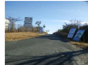
西遠浄化センター 南西入口

※歩行者のみ通行可。 車は通行不可。 ※工事エリアを横切するため、誘導員の指示に従ってください。