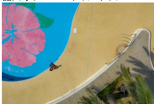
舘山寺サゴーロイヤルホテル