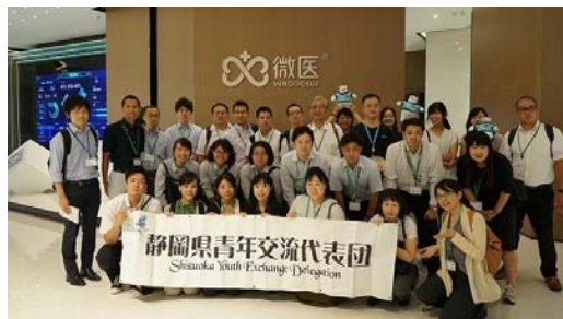
日中青年代表交流