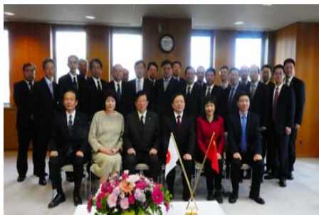
静岡県・浙江省経済促進機構 第 27 回全体会議

強固な友好関係を有する浙江省との絆をさらに深め、多分野において重層的な、互惠互助の精神に基づく交流を展開する。