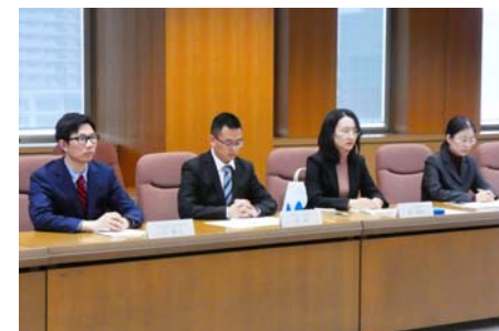
技術研修員の受入