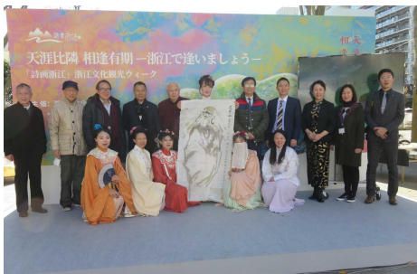
浙江文化観光ウィーク

強固な友好関係を有する浙江省との絆をさらに深め、多分野において重層的な関係を築き、県民にメリットのある交流を展開する。