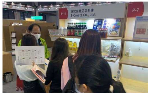
中国国際輸入博覧会