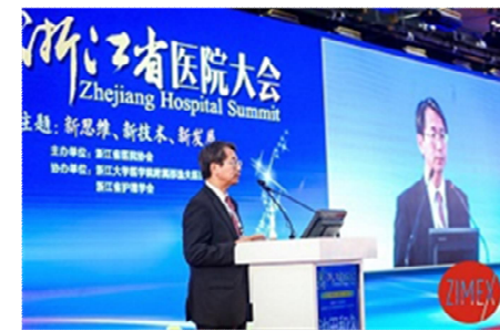
医療・介護分野での交流 (R1 浙江省病院大会へ参加)