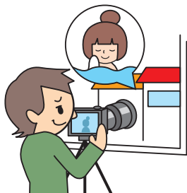
住居等の盗撮 (第3条関係)