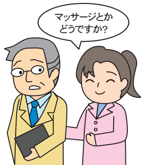
深夜におけるマッサージ等の客引き