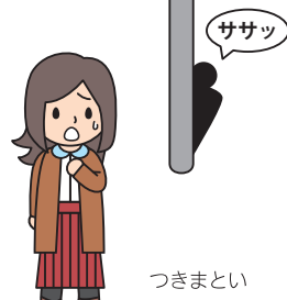
反復したつきまとい等 (第4条関係)