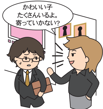
性風俗店・接待飲食店等への客引き (いわゆるフリーの客引き)