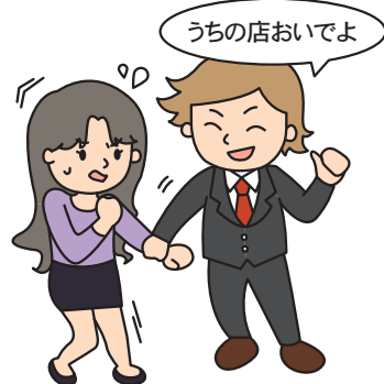
執ような客引き(業種は問いません)