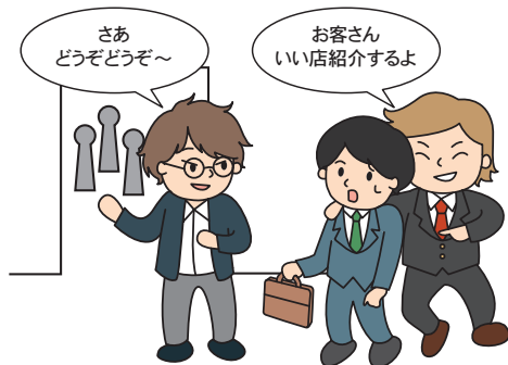
風俗案内所等への客引き