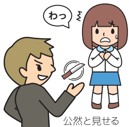
公然と見せる (第2条関係)