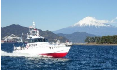
表紙写真：警備艇するが出港！

「Reliance（リライアンス）」とは、「信頼」という意味です。 静岡県警察は、県民の皆様の期待と信頼に応えることを指針として、日夜活動を続けています。