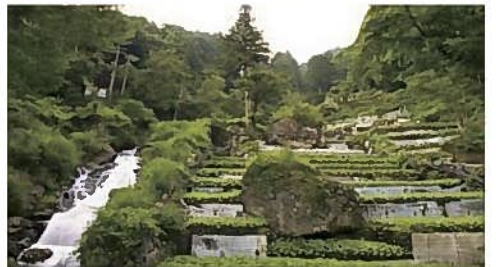
世界農業遺産「静岡水わさびの伝統栽培」