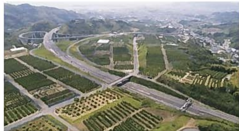
農地基盤整備事業を活用したみかん園地

南は駿河湾、北は南アルプスに至る広大な地域の大部分を占める中山間地域では、昔から傾斜地を利用し、みかん等の柑橘やお茶、わさび等が生産されています。また、都市近郊の平野部では限られた面積の中で、イチゴやトマト、枝豆や花き(バラ等)の施設栽培が行われており、地域の特性を活かした多彩な農芸品が生産されています。