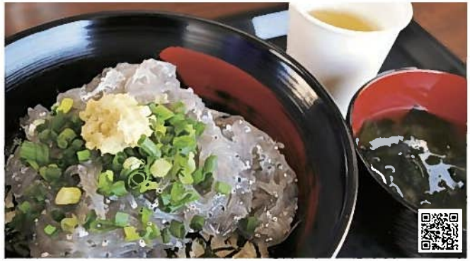
田子の浦しらす(富士市) *平成29年にGI登録

富士山とともに① 富士山の栄養豊かな水が流れ込む田子の浦沖で、中袋がある一艘曳き漁法でとり、水揚げと同時に船上で氷締めしました。お買い求めは、「富士山しらす街道」の各店などで。