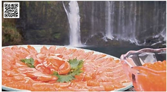
ニジマス(富士宮市)

富士山とともに① 富士山の栄養豊かな水が流れ込む田子の浦沖で、中袋がある一艘曳き漁法でとり、水揚げと同時に船上で氷締めしました。お買い求めは、「富士山しらす街道」の各店などで。