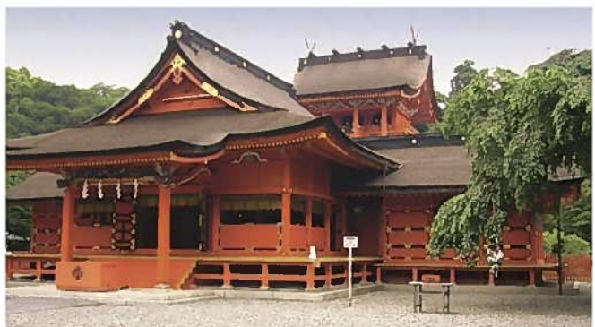
富士山本宮浅間大社(富士宮市)

岳南電車は全駅から富士山の絶景を満喫でき、沿線には湧水スポットや史跡・ご当地グルメも多く途中下車しながら巡るコースがおすすめです。平成26年には日本夜景遺産に認定され、「鉄道夜景」としても注目されています。