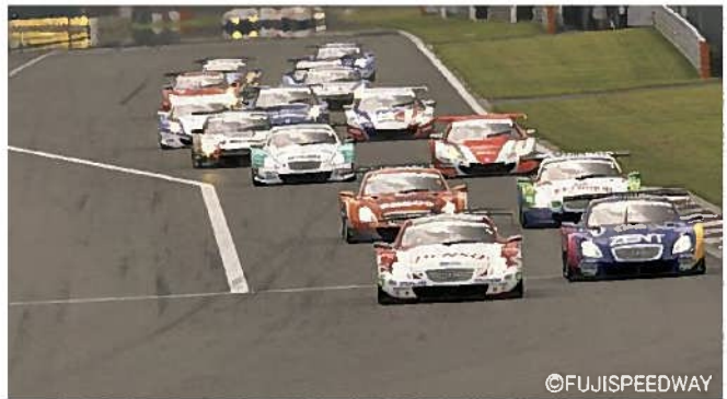
富士スピードウェイ(小山町)

富士山をバックにして走る一周4,563mの日本最大のレーシングコースです。2020年に開催される東京五輪の自転車競技の会場に決定されました。