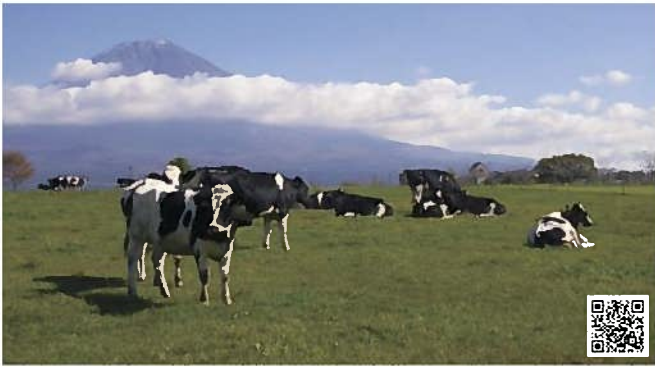
朝霧高原(富士宮市)

富士山とともに③ 富士山の豊富な伏流水を活かして、昭和初期から養殖に取り組み、生産量は日本一です。養殖池の見学は県営富士養鱈場で、ニジマス料理は「富士宮にじます学会」の認定店などで。