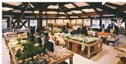
②道の駅 農林水産物直売所 湯の花(南伊豆町)

静岡県のがんばる新農業人支援事業を活用したイチゴの新規就農者で、静岡県が誇る「紅ほっぺ」産地の一端を担っています。また、安全性の高い殺菌、殺虫剤を使用し、食の安全に努めています。