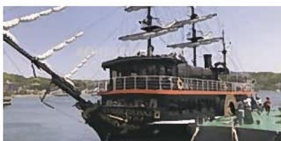
③道の駅 開国下田みなと(下田市)【昼食】

下田港を一望できる道の駅で、新鮮な海の幸をご賞味いただけます。また、併設する直売所では、海産物をはじめとした地場産品を購入できます。