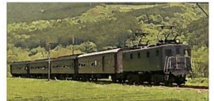
⑥レトロ列車 特別運行 『サミット号』乗車(島田市)

基盤整備を行った茶園にて、地元茶農家による園地の説明や乗用型茶摘採機の実演を行います。