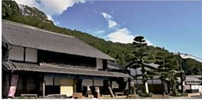
①岡部宿大旅籠柏屋(藤枝市)

8:30 9:10~10:00 10:15~11:05 11:20~12:20 12:50~13:40 14:05~14:55 15:30 16:45 17:00 ①岡部宿大旅籠柏屋 ▶ ②(有)龍勢グリーン ▶ ③玉露の里【昼食】 ▶ ④まんさいかん藤枝 ▶ ⑤(株)ジャパン・ベリー ▶ 静岡空港 ▶ 静岡駅 ▶ グランシップ