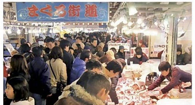
焼津さかなセンター(焼津市)

大井川に沿って南北にSLが駆け抜けます。大井川や茶畑、山々など、のどかな風景が楽しめます。