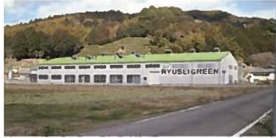
②(有)龍勢グリーン(藤枝市)【茶】

東海道五十三次である岡部宿の様子を伝える大旅籠柏屋を見学。旧東海道沿いの街並みを楽しめます。