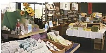
⑤さすき園(島田市)【茶】

さすき園内レストランでの昼食です。静岡県牧之原市で栽培された自然薯の料理など、静岡の食材にこだわった料理を堪能できます。