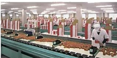
①アメーラトマト集出荷場(藤枝市)

8:00 8:30~9:20 10:00~11:00 11:20~12:20 宿舎 ▶ アメーラトマト集出荷場 ▶ ②なかじま自然薯園 ▶ ③ふじのくに茶の都ミュージアム ▶ 12:40~13:30 13:30~14:10 14:40~15:40 16:40 16:55 ④茶の庭れすとらん【昼食】 ▶ ⑤さすき園 ▶ ⑥酒蔵/酒米生産者 ▶ 静岡駅 ▶ グランシップ