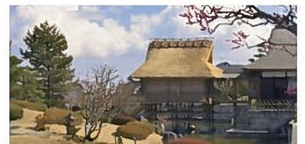
③ふじのくに茶の都ミュージアム(島田市)

牧之原台地で、静岡在来の自然薯を40年以上栽培しています。農園併設の直売所や県内外の飲食店への直販、インターネット販売を行っています。