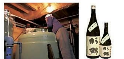
⑥酒蔵(杉井酒造)/酒米生産者(藤枝市)

明治から続く茶農家が経営するカフェや直売所です。ミニミニお茶工房で茶の製造を見学ができます。