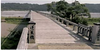
①蓬萊橋(世界一長い木造歩道橋) (島田市)

8:00 8:10~8:40 9:00~9:10 9:10~9:50 10:00~12:00 宿舎 ▶ ①蓬萊橋 ▶ ②牧之原大茶園 ▶ ③乗用型茶摘採機の実演 ▶ ④ミニ地域交流会(さんぼ茶屋)【昼食】▶ 13:05~13:45 14:43~15:10 16:00 16:55 17:10 ⑤KAWANE抹茶(株) ▶ ⑥レトロ列車『サミット号』乗車(家山駅~新金谷駅) ▶ 静岡空港 ▶ 静岡駅 ▶ グランシップ