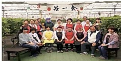
⑤(株)ジャパン・ベリー(藤枝市)

JA大井川のファーマーズマーケット。店内では、出荷員の育てた地元産の農作物だけでなく、漬物や惣菜品なども販売しております。