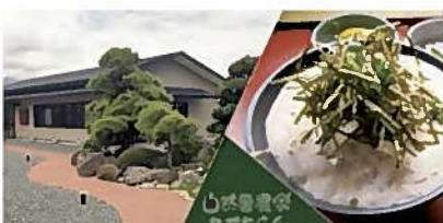
④茶の庭れすとらん とろろ屋ととろ (島田市)【昼食】

お茶の博物館です。お茶の産業、文化、歴史、民族、機能性まで、実物資料だけでなく映像や実演によってわかりやすく紹介します。