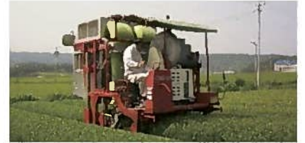
③乗用型茶摘採機の実演(島田市)

ここで製造した碾茶(てんちゃ:抹茶の原料となる乾燥茶葉)は、全国展開しているアイスの原材料として使われています。