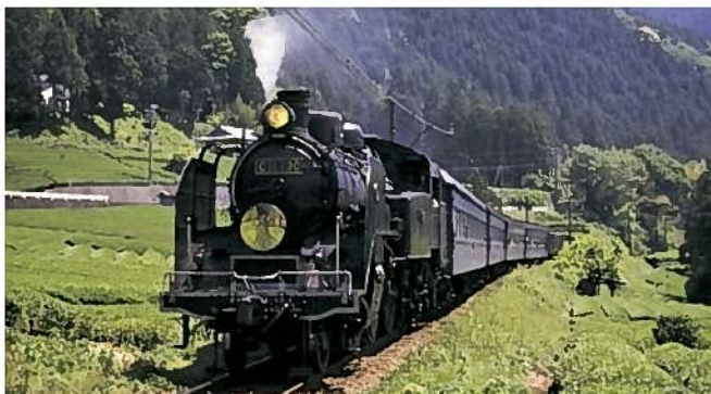
大井川鉄道 SL列車(島田市・川根本町)

日本唯一のアプト式トロッコ列車で知られる、南アルプスあぶとライン(大井川鉄道)の駅。湖に浮かぶ島に見える名物駅です。