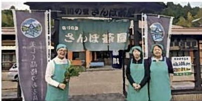
④ミニ地域交流会(さんぼ茶屋) (島田市)【昼食】

「世界一長い木造歩道橋」としてギネス認定されている「蓬萊橋」は、牧之原台地の開墾に伴う農業用の橋(農道)でもあります。