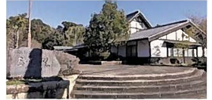
③玉露の里(藤枝市)【昼食】

寒冷紗で被覆した、かぶせ茶を主力とした経営を行っています。茶園を見学しながら、生産者よりかぶせ茶の説明を受けられます。