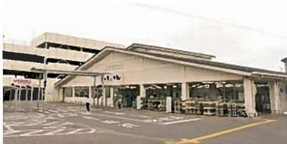
④まんさいかん藤枝(藤枝市)

施設内の茶室「瓢月亭」では、日本三大玉露である朝比奈玉露や地元産抹茶が楽しみ、御食事処「茶の華亭」では、玉露や地元食材を使用した旬の料理が味わえます。