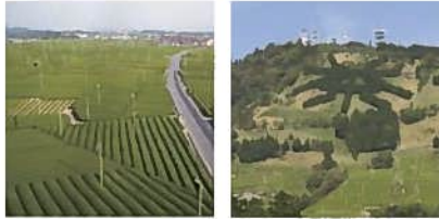
②日本一の牧之原大茶園(島田市)

地元の農家の女性達が運営する「さんぼ茶屋」です。農林水産大臣賞など各賞を受賞した緑茶・和紅茶を楽しみながら、昼食とともに、地元担い手と交流します。