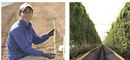
②なかじま自然薯園(牧之原市)

静岡県で開発された甘さが通常の2倍もある「アメーラ」トマト。ブランド管理と販売戦略について(株)サンファーマーズが説明します。