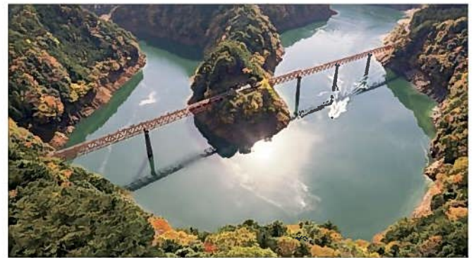
奥大井湖上駅(川根本町)

日本唯一のアプト式トロッコ列車で知られる、南アルプスあぶとライン(大井川鉄道)の駅。湖に浮かぶ島に見える名物駅です。