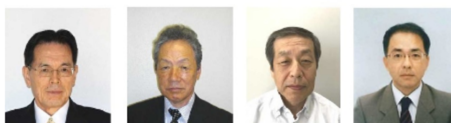
木村 裕次 コーディネータ 高田 勝己 コーディネータ 太田 啓介 コーディネータ 水上 友人 コーディネータ