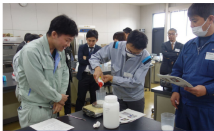
令和元年12月16～17日 場所:徳島県産業技術センター

「体験の場」のステージ2では、取組初期にうまくいかずあきらめることにならないよう、企業の方に実際にCNFに触れてもらって、取扱いのコツを体得してもらうセミナーなどを開催しております。