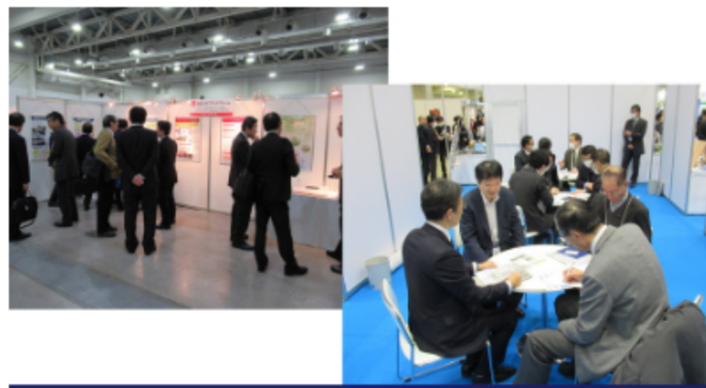
令和元年 11月19日 ふじのくに CNF 総合展示会 令和2年1月29日～31日 新機能性材料展2020 等

また、CNF利活用製品を開発した企業には、展示会出展支援やビジネスマッチングなどで、販路開拓の支援も実施しております。 これらの活動を通じて、四国でCNF関連産業創出を目指しております。