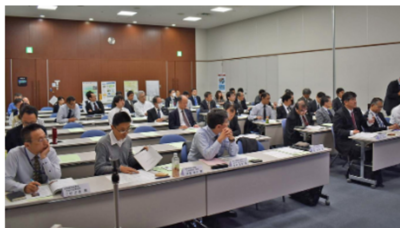
令和元年11月26日 場所:サンポートホール高松

「学びの場」のステージ1では、実用化先行企業の講師等に成功のポイントや苦労談を話していただくセミナーなどを開催し、これから取り組む企業がスムーズに取組めることを目指しています。