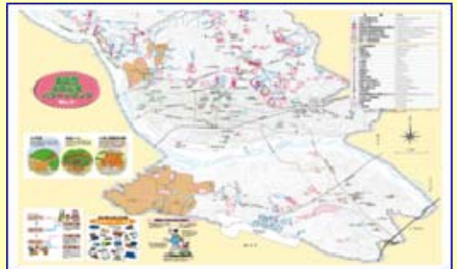
島田市土砂災害ハザードマップ